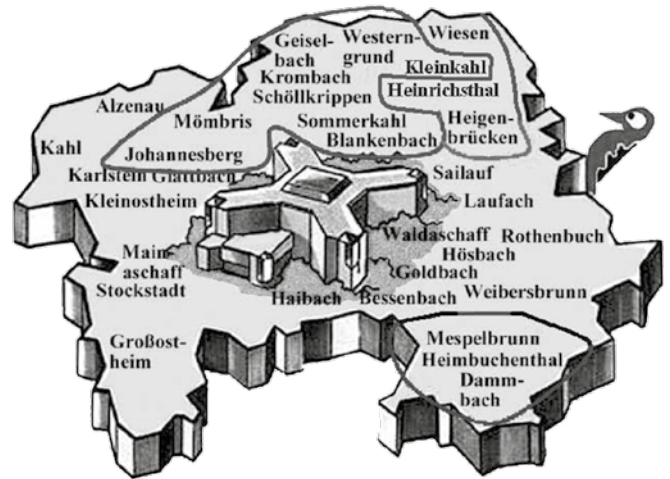
Logo des Landkreises Aschaffenburg mit freundlicher Genehmigung des Landratsamtes Aschaffenburg

Hauptstraße 71 · 63875 Mespelbrunn Telefon: 060 92/14 31 · Fax: 060 92/82 35 26 E-Mail: heidrun.schreck@vhs-kahlgrund-spessart.de Webseite: www.vhs-kahlgrund-spessart.de Öffnungszeiten: Mo. und Mi. von 10.00 bis 13.00 Uhr